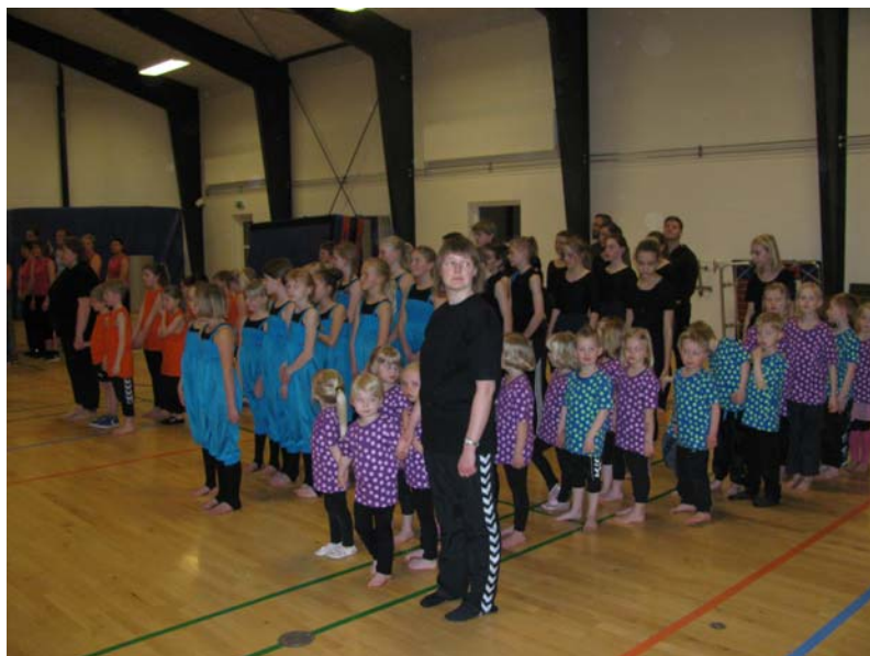
Så er vi klar til at synge nationalsangen