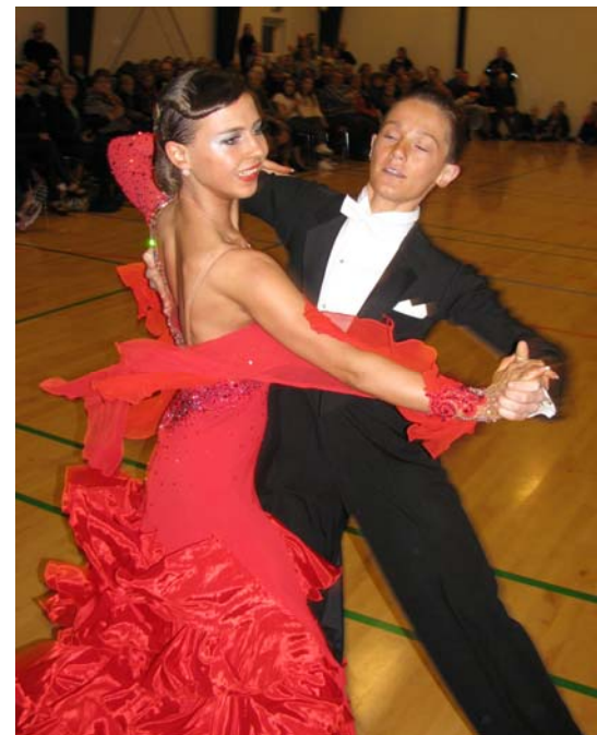
Et festligt danseindslag, var med til at gøre gymnastikopvisningen 2014 til en særlig en af slagsen.