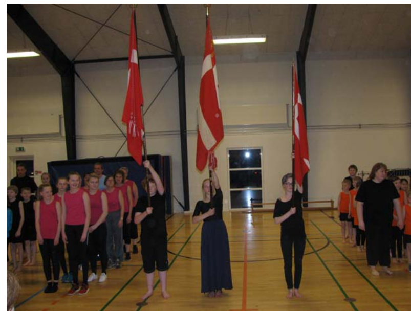
I 2014 havde vi 3 faner til gymnastikopvisningen.