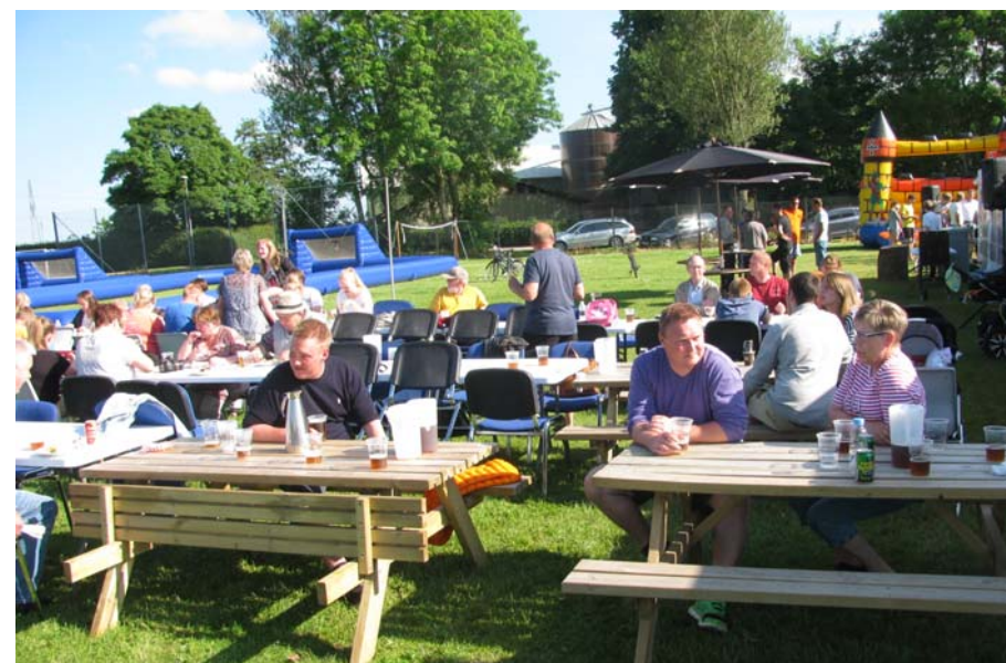
Det var en rigtig god sommer i 2014